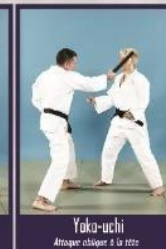
Yoko-uchi Attaque oblique à la tête