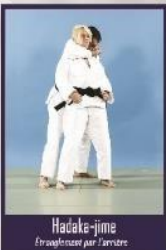
Hadaka-jime Étranglement par l'arrière