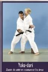
Yoko-dori Saisie de côté en contournant les bras