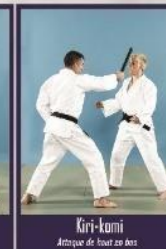
Kiri-komi Attaque de bas en bas