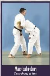
Mae-kubi-dori Saisie au cou de face