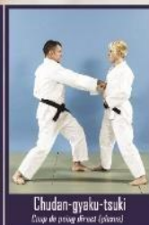
Chudan-gyaku-tsuki Coup de poing indirect (revers)