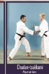
Chudan-tsukumi Piquet de face