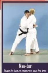
Mae-dori Saisie de face en contournant sous les bras