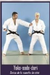
Yoko-sode-dori Saisie de la manche de côté