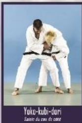
Yoko-kubi-dori Saisie du cou de côté