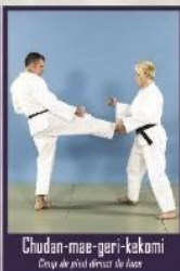
Chudan-mae-geri-kekomi Coup de pied direct de face