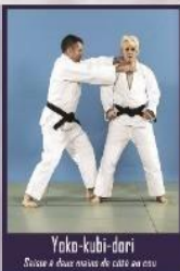
Yoko-kubi-dori Saisie à deux mains de côté au cou