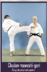
Chudan-mawashi-geri Coup de pied circulaire