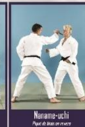
Naname-uchi Piquet de bas en revers