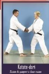
Katate-dori Saisie du poignet à deux mains