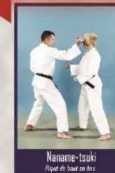
Naname-tsuki Piquet de bas en haut