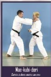
Mae-kubi-dori Saisie à deux mains au cou