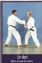
Eri-dori Saisie cravate du revers