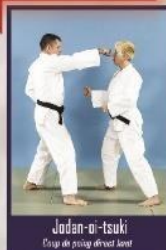
Jodan-oi-tsuki Coup de poing direct haut